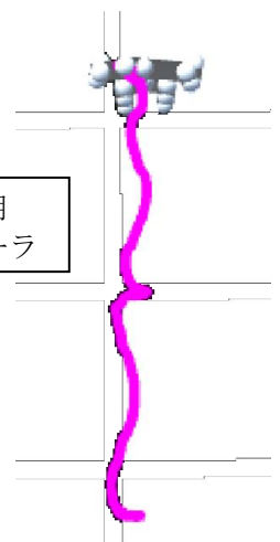
図 3：歩行時の経路表示(天井からの視点)